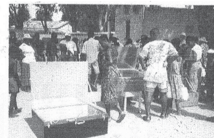
Kochdemonstration in Miary. Die zahlreich erschienene Bevölkerung reagierte interessiert auf den Sonnenkocher und stürzte sich buchstäblich auf den Reis.

Bis heute wurden 1400 Solarkocher zu günstigen Preisen an die Bevölkerung verkauft. Darüber hinaus organisiert ADES