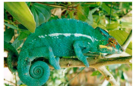
Rund 60 endemische Arten: Chamäleon

Die Tier- und Pflanzenwelt Madagaskars ist einmalig. Aufgrund der Insellage sind zahlreiche Arten endemisch, das heisst sie kommen nur auf Madagaskar vor. ADES versucht zu bewahren, was davon übrig geblieben ist.