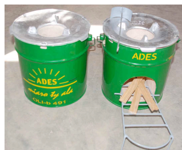
Energieeffizienz made in Madagaskar: «OLI-c» und «OLI-b»

Das Interesse an den neuen Energiesparöfen ist bei der madagassischen Bevölkerung riesig, denn die beiden Modelle sind effizient und kostengünstig. Die Nachfrage übersteigt derzeit das Angebot bei weitem.