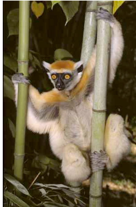
Nur in Madagaskar: Ein Sifaka-Lemur, eine von 32 endemischen Lemur-Arten

Knapp zwei Wochen lang wurde Ende Oktober an der 10. Uno-Artenschutzkonferenz im japanischen Nagoya darüber debattiert, wie die globale Artenvielfalt geschützt werden kann.