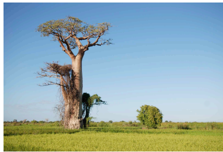
Verbreitet in der Region: riesige Baobabs

Region bestmöglich nutzen. Der Distrikt Morombe ist das grösste Reis-Anbaugebiet Madagaskars. Ausserdem wachsen hier die imposantesten und eigenartigsten Affenbrotbäume der Welt, die sogenannten Baobabs. Diese Vielfalt wollen wir mit dem Vertrieb unserer bewährten Solarkocher und mit den neuen effizienten Holzkochern schützen.