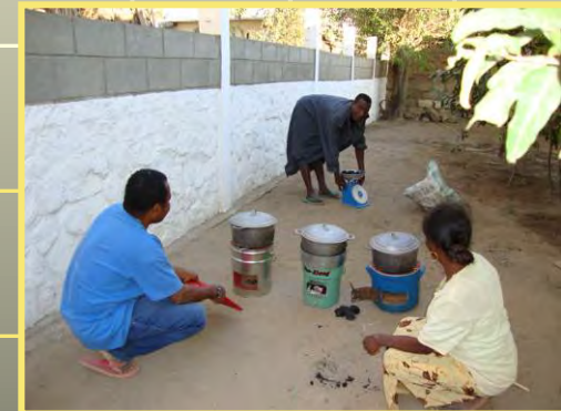
Testläufe der Prototypen