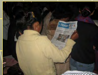
Die gesamte Mada-Equipe erfährt an der Jubiläumsfeier vom neuen Kocher