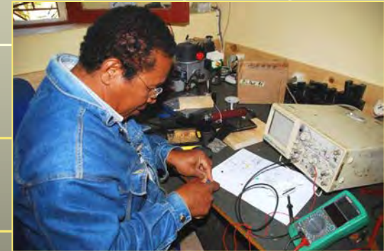
Ein eigener Akku mit Laderegler entsteht