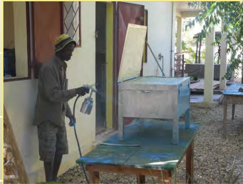
Das Blech wird gespritzt

Mit viel Enthusiasmus ist der neue Solarkocher entstanden: