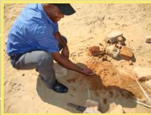
Suche nach dem richtigen Lehm