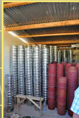
Kessel für die Verschalung