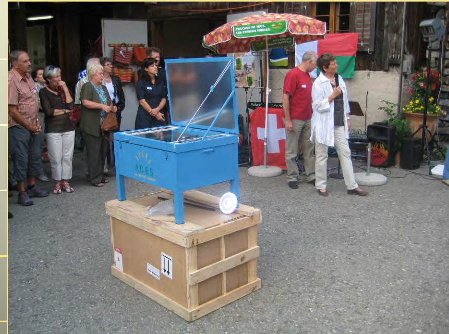
Die Überraschung an der Jubi-Feier in der Schweiz ist perfekt!