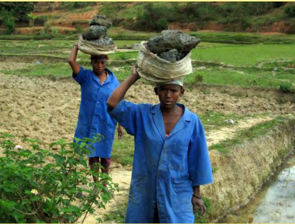
Bei den Reisfeldern wird der Ton gestochen