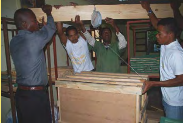
In Kiste verpackt und ab in Schweiz