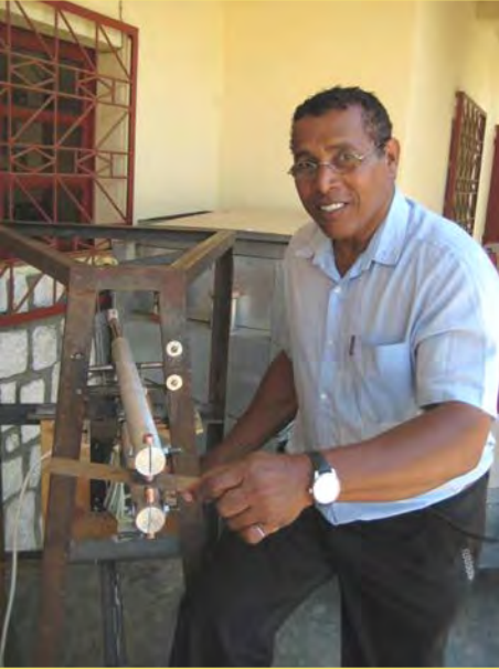
Astina tüftelt: Punktlötmaschine

Mit viel Enthusiasmus ist der neue Solarkocher entstanden: