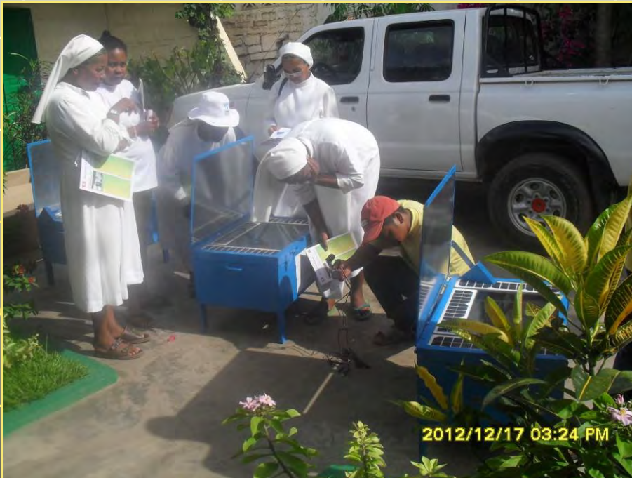
Eine Familienfrau, ein Offizier und Schwestern gehören zu den ersten KäuferInnen