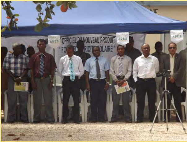
Die Honorablen beim Singen der Nationalhymnen