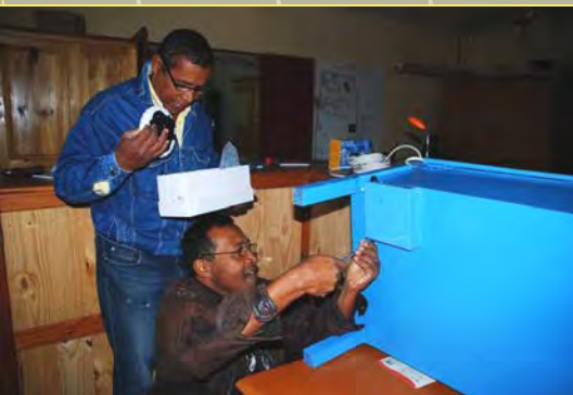
Akkumontage und Stromleiste