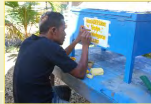
Der Dank an ADES Schweiz wird gespritzt