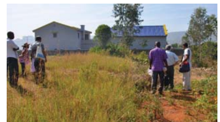
April 2013 in Fianarantsoa: Land in Sicht...

für das Verkaufsgebäude wird am Freitag fertig sein. Und schon sind die ersten Arbeiten für die Produk-