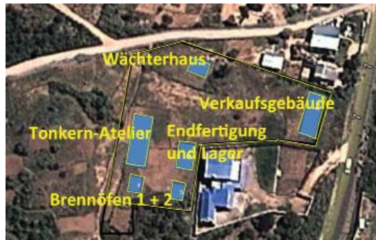
Areal für die neue OLI-Produktion in Fianarantsoa.

finanziellen Unterstützung von EnDev verwirklichen. EnDev heisst 'Energising Development' und ist ein weltweites, von sechs Geberländern finanziertes, Programm für den Energiezugang in Entwicklungsländern. An diesem Programm beteiligt sich auch die Schweiz. Die direkte Ansprechpartnerin von ADES ist die GIZ, die >>>