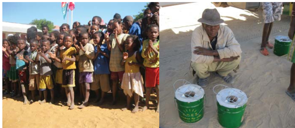
Glückliche Menschen: Die vom WWF zusätzlich vergünstigten „Zyklon“-Öfen sind sehr beliebt.

Diese zusätzliche Produktionsstätte für die OLI-Öfen ist dringend notwendig, denn die bisherige Fabrikation platzt aus allen Nähten: ADES kann die enorme Nachfrage und die weitere starke Verbreitung der umwelt- und gesundheitsschonenden Energiesparöfen nur mit diesen erweiterten Kapazitäten befriedigen.