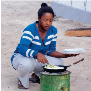
Mère de famille malgache

«Avec mon ancienne cuisinière, je consommais environ deux sacs de charbon de bois par mois, pour préparer les repas pour les cinq membres de ma famille. Aujourd’hui, grâce à ma nouvelle cuisinière à économie d’énergie, je consomme deux fois moins de charbon et j’économise plus de la moitié de ce que je dépensais autrefois.»