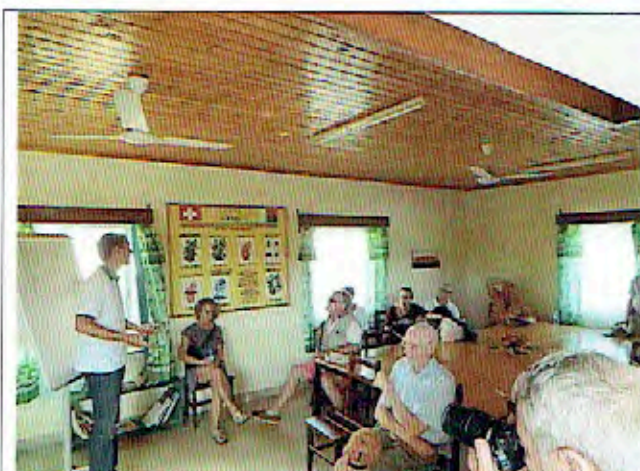
Prinz mit Entourage und Kader des WWF

Der Prinzgemahl Henrik, von Dänemark in unserem Zentrum Tuléar zu Besuch am 1. Dezember 2014