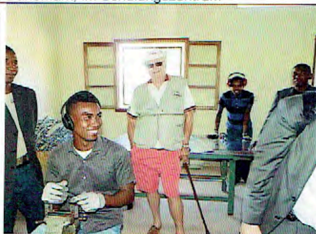
Dänemark in der Hofschreinerei hergestellt werden könne.....