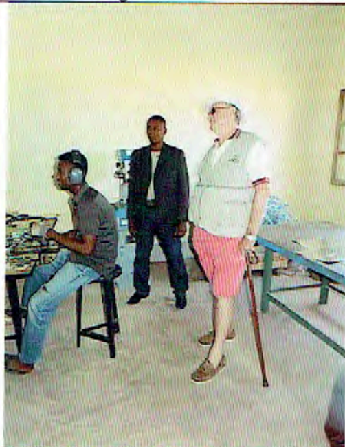
Im Metallatelier. Ein Solarkocher wollte er gerade mitnehmen, sie entschieden sich dann aber für die Baupläne, damit er in