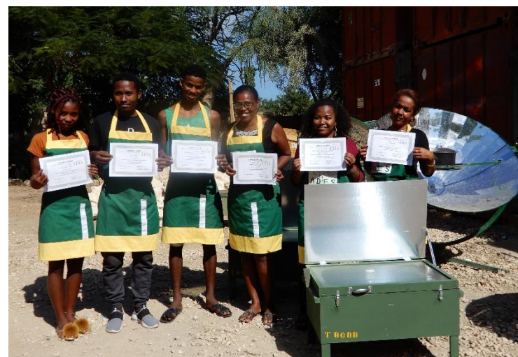
Interne Solarkocher-Ausbildung bei ADES in Toliara