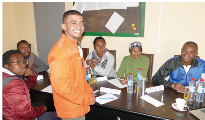
La première formation à propos des genres a eu lieu en mai chez ADES

Dans la société malgache, les femmes sont traditionnellement soumises aux hommes. Bien qu'une loi sur l'égalité des droits existe, celle-ci n'est pas mise en œuvre dans le domaine privé. En particulier dans les régions rurales, les femmes supportent la plus grande charge des tâches quotidiennes, comme la récolte du bois de combustion, la cuisine, l'éducation des enfants ou encore la tenue du ménage. Même les femmes qui assument des tâches à responsabilités dans les zones urbaines doivent endosser une position subalterne et de dépendance lorsqu'elles retournent dans leur terre natale rurale. La violence domestique est un problème répandu.