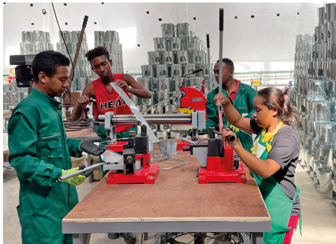
La production de sceaux métalliques à Antananarivo marche à plein régime

Avec l'ouverture du nouvel atelier de ferblanterie à Antanarivo, ADES débloque les goulots d'étranglement dans la production et augmente massivement ses capacités de production. Alors qu'ADES s'est développée bien plus fortement que prévu en 2021, le nouveau site de production arrive à point nommé. Il permet aussi de raccourcir nettement les distances de transport, en particulier au nord de l'île.